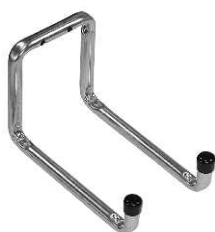
hak podwójny U

Firma Domax, podążając za potrzebami swoich klientów, wprowadziła nowego typu rurkowe wsporniki garażowe i ogrodowe. Są to wyroby o wysokiej estetyce, projektowane specjalnie do funkcji, jaką mają spełniać (np. haki na opony samochodowe, haki rowerowe, haki do węża ogrodowego, itd.).